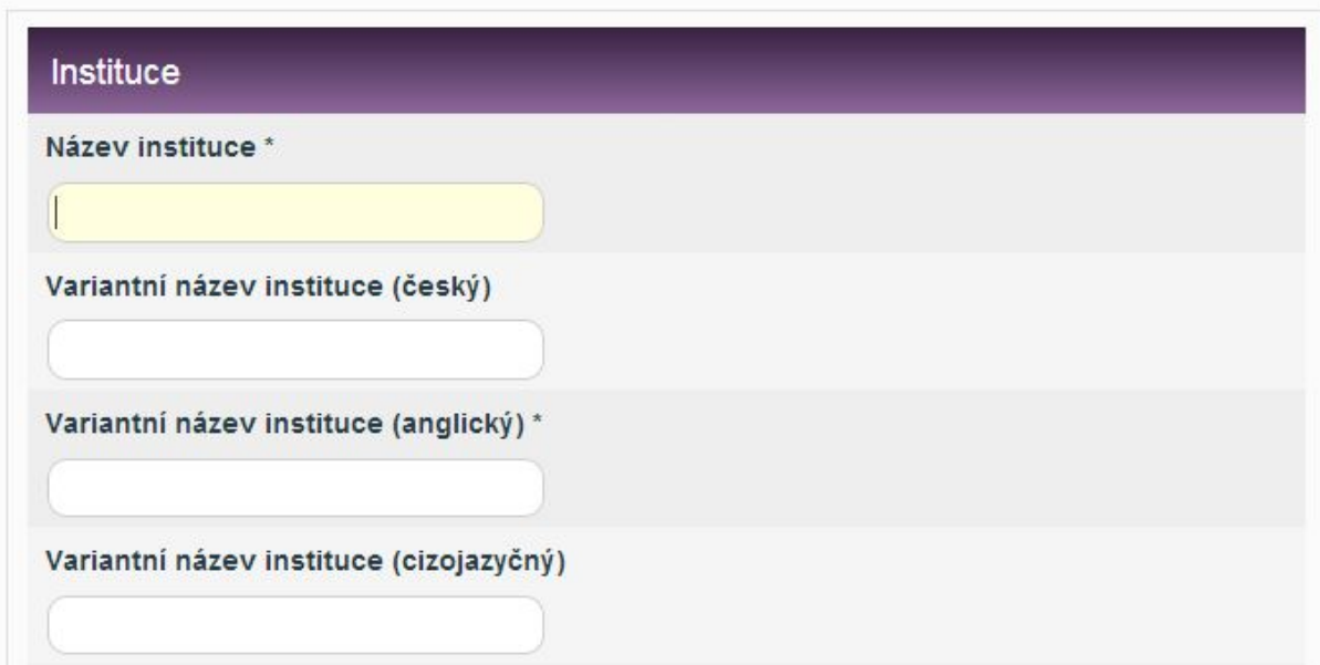
Obr. 1: Formulář požadavku na přidělení sigly na webu Oddělení souborných katalogů NK ČR

Políčka formuláře označená hvězdičkou jsou povinná (musí být vyplněna, jinak nebude formulář odeslán).