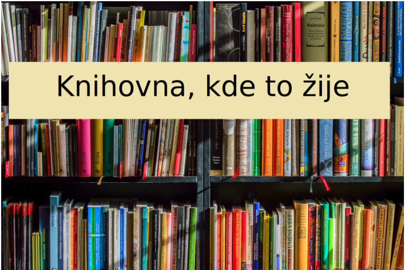
Obr. 8: Příklad využití barevného pruhu jako podkladu pro text v obrázku (zdroj: archiv autorky 4) )

Obr. 8 ukazuje použití jednobarevného pruhu pro zlepšení čitelnosti textu.