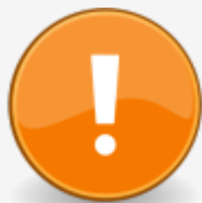
Obr. 4: Vykřičník

Jako příklad si ukažme obrázek vykřičníku (viz obr. 4), sloužící k označení důležitých informací. Obrázek má název „vykr2.png“.