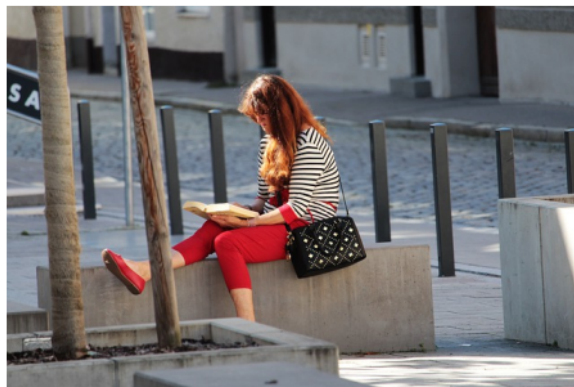
Obr. 3: Vhodně a nevhodně vybraný ilustrační obrázek