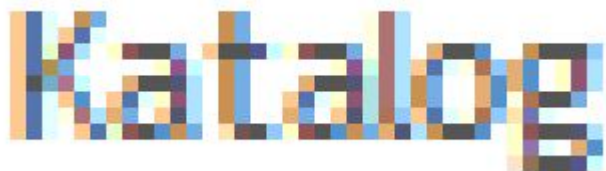
Obr. 1: Rozostření textu ve formě obrázku při zvětšení stránky

Na obr. 1 vidíte ukázkou rozostření obrázkového textu, ke kterému dojde při zvětšení obrázku/stránky.