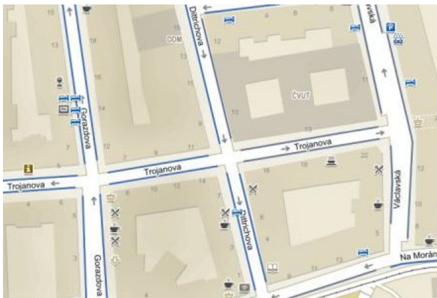
Obr. 4: Mapa s parkovacími zónami, jak ji vidí uživatel webu s poruchou vnímání červené barvy

Na obr. 4 vidíme, jak tutéž mapku vnímá uživatel, který má poruchu vnímání červené barvy.