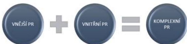
Obr. 18: Směry komunikace PR