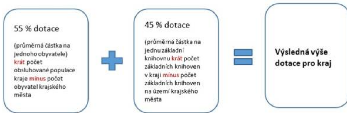
Obr. 16: Propočet dotace na výkon RF

Vždy je ale nutné brát v úvahu rozdílnost jednotlivých krajů, kde se propočet dotace může lišit od celostátního doporučení a odvíjet se od dokumentů schválených zastupitelstvem kraje.