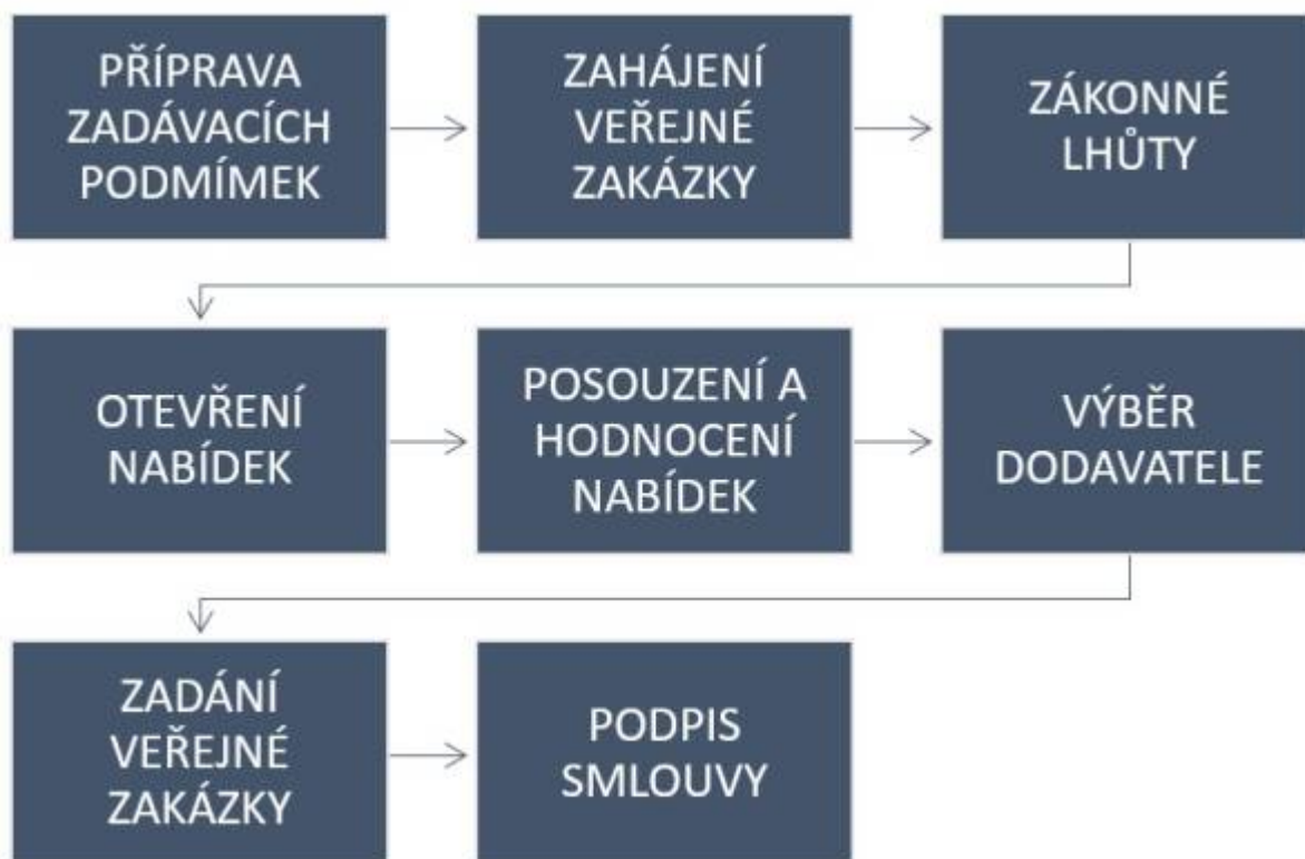
Obr. 11: Fáze veřejných zakázek