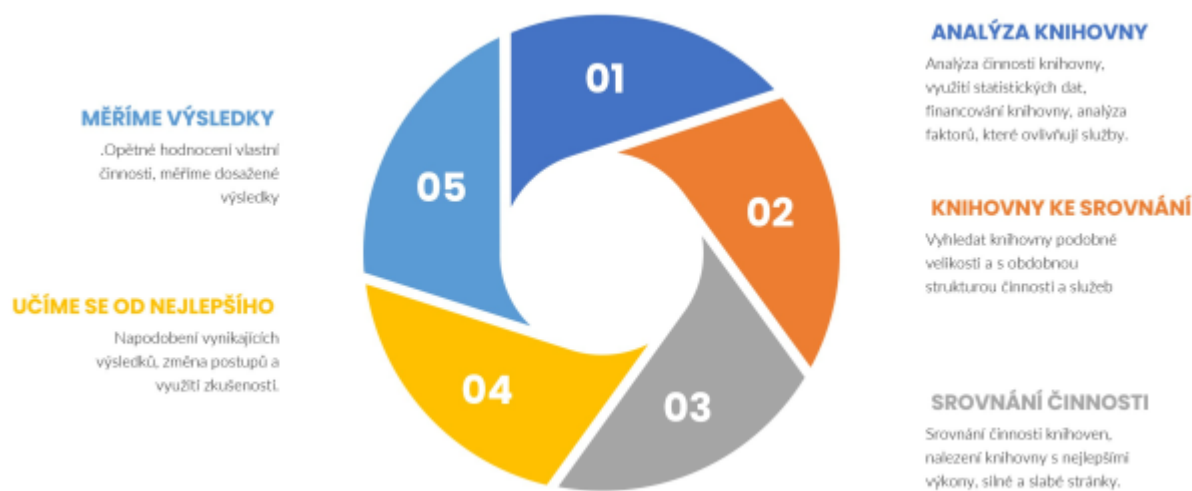
Obr. 19 – Průběžné hodnocení činnosti knihovny