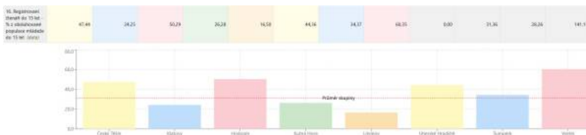
Obr. 21 – Procento registrovaných čtenářů v kategorii do 15 let z obsluhované populace mládeže do 15 let