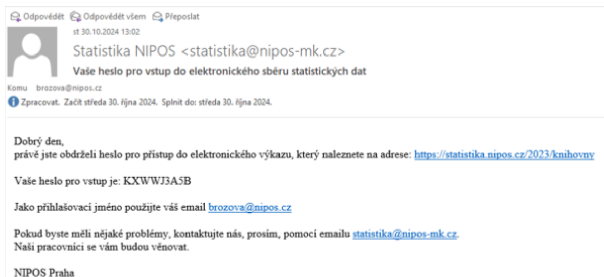
Obr. 14 – Ukázka úvodní zprávy pro nového uživatele databáze elektronického sběru

Pro obsluhované knihovny je přímé vkládání dat (s platností od ledna 2025) zcela novou možností, jak odevzdávat statistická data.