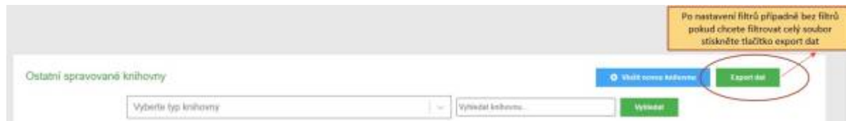
Obr. 12a) - Ukázka exportu dat z pohledu pověřené knihovny

kterým převede všechna data z elektronických výkazů svých obsluhovaných knihoven do formátu MS Excel pro další práce. Může ale také filtrovat knihovny podle typu a vybranou skupinu pak následně exportovat. Export dat je velmi dobrý a rychlý nástroj pro kontrolu a vyhodnocování celkových i dílčích dat.