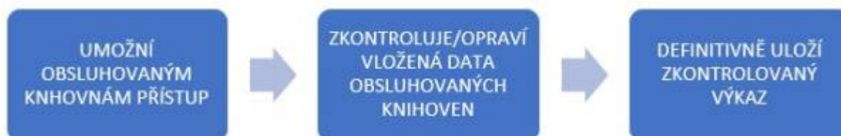
Obr. 6 - Postup práce s daty - pověřená knihovna