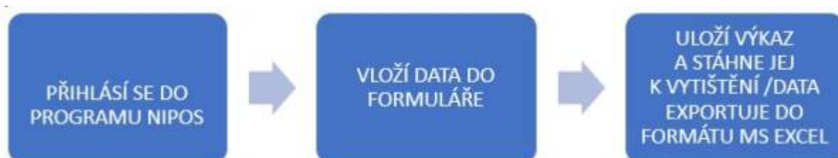
Obr. 7 - Postup práce s daty - obsluhovaná knihovna

Krajská knihovna bude mít možnost exportovat data do MS Excel za celý kraj. V rámci staženého souboru bude možné filtrovat data podle pověřených knihoven i podle typu knihovny. To znamená, že bude mít k dispozici na jednom místě všechna data za celý kraj a připravená pro další práci.